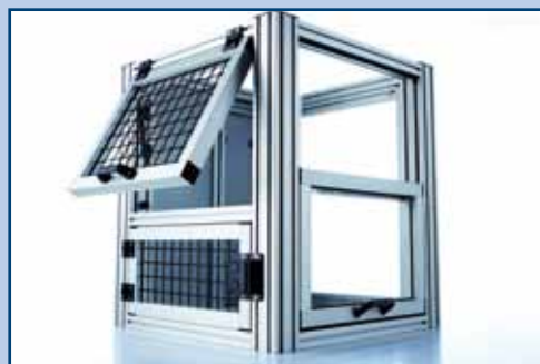
PROFILE + SYSTEME