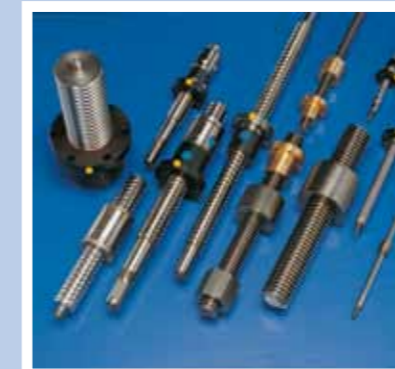
Trapez- und Kugelgewindetriebe