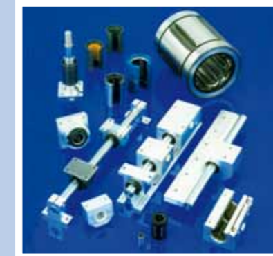
Führungswellen / Linearkugellager